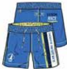
C02 PALACE BLU contrast OCEAN BLUE contrast CANARY YELLOW C/C