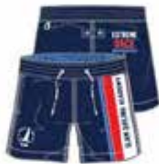
144 OCEAN BLUE contrast SLAM RED contrast PALACE BLUE